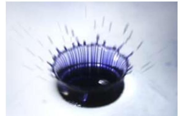
Регулярная структура картины слияния окрашенной капли

Отдельное заседание посвящается памяти академика РАН А. Г. Куликовского